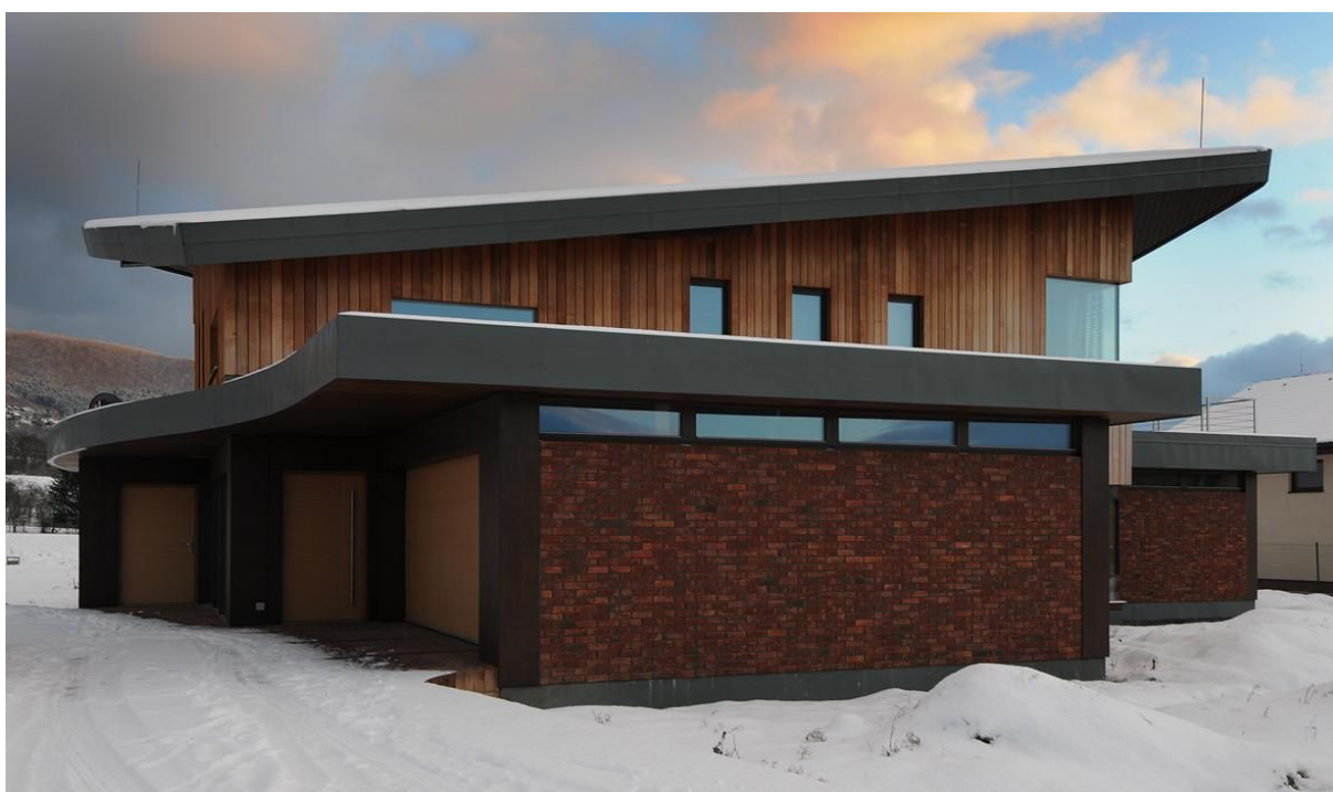
Obr. 5, 6- Spojenie materiálov - tehlový obklad a cédrové drevo pôsobia jednotne a zdôrazňujú ideu domu v „prírodnom prevedení“