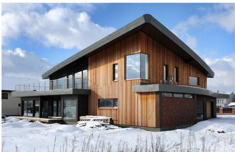
Obr.4 – Energia do domu prichádza cez preslnenú zimnú záhradu