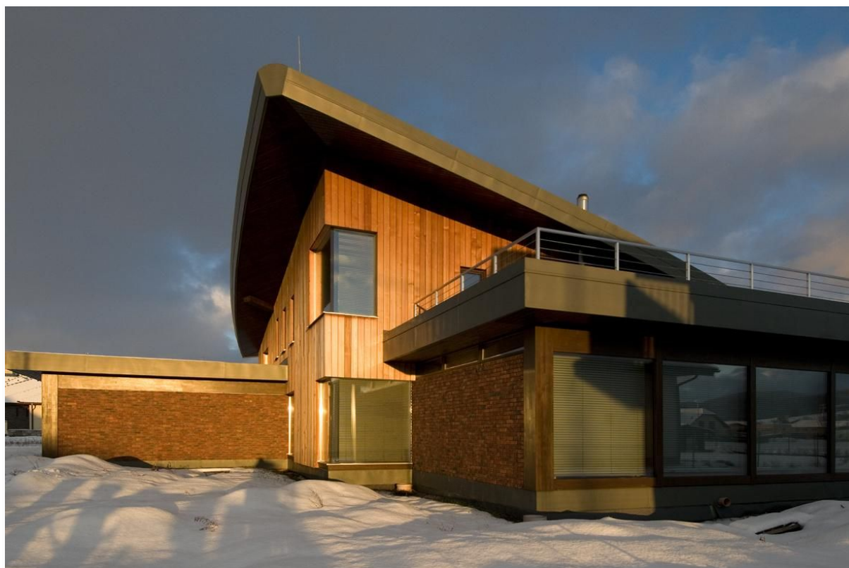
Obr.1- titulná fotka

Túžbu po individualite je možné vyjadriť mnohými spôsobmi. Bývanie je jedným z nich. Štvorčlennej rodine z Dubnice Nad Váhom sa tento sen splnil. S návrhom architektonického ateliéru VAN JARINA získali originálne bývanie s čistým technickým prevedením.