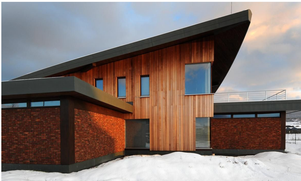
Obr.2- Strecha v tvare padajúceho listu

Hlavnou ideou stavby sa stala spomínaná strecha založená na prírodnom motíve v kontraste s technickými povrchovými materiálmi. Základom konštrukcie zaujímavého tvaru je sedlový krov, ktorý je osadený uhlopriečne na pôdorys stavby. Materiálovým prevedením strešnej konštrukcie je rheizink (zvetralý titanzinok).