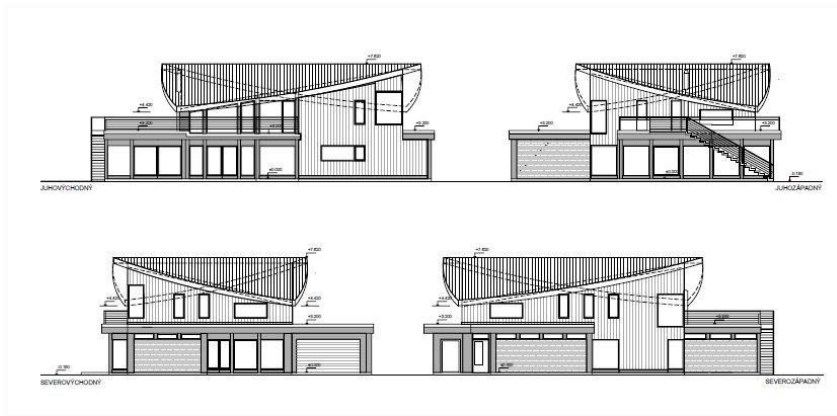
Pdf.1- Jednotlivé pohľady znázorňujú originálne konštrukčné riešenie strechy