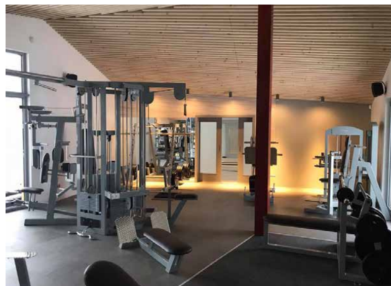
↑ Útulný interiér s dreveným podhľadom.