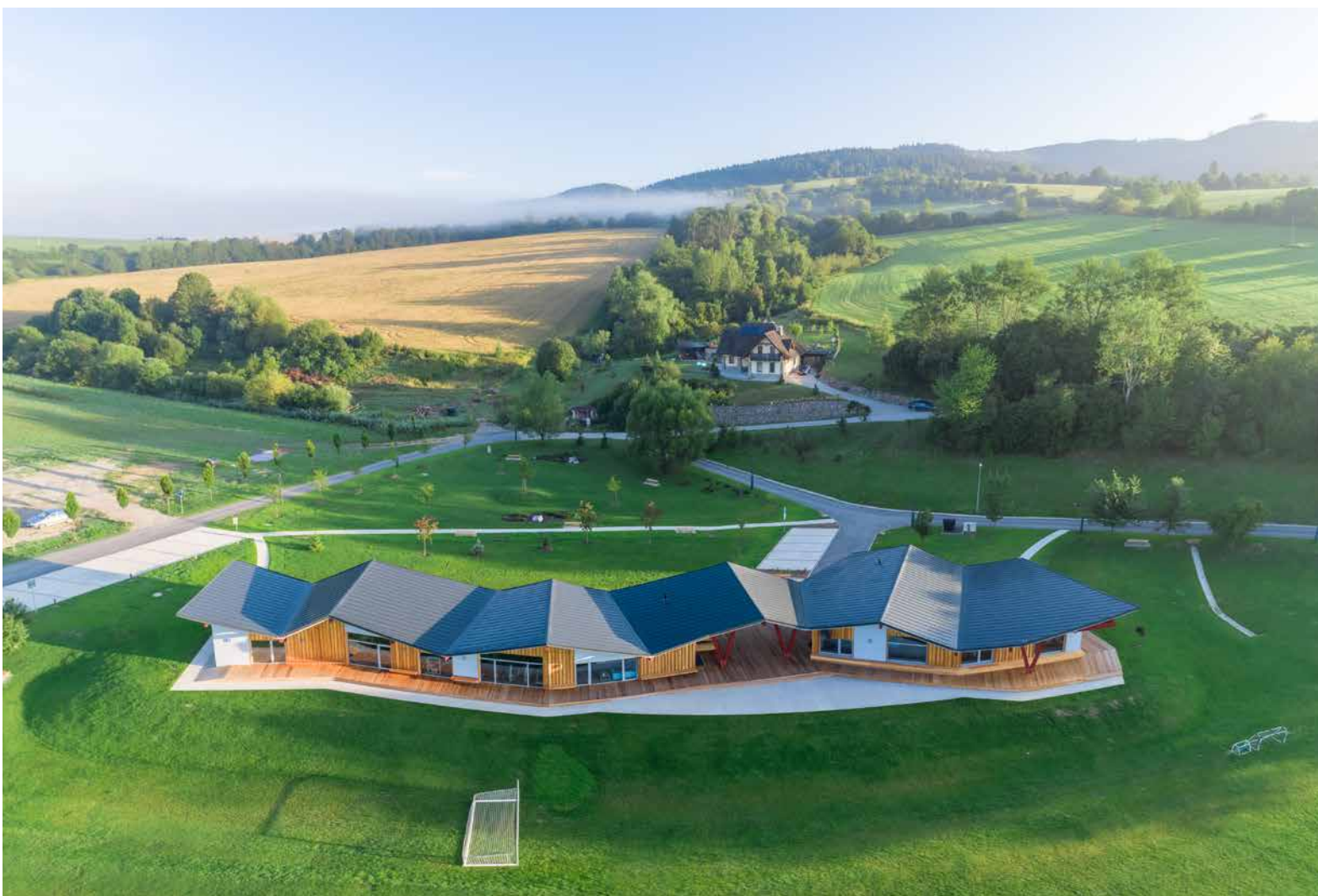
↑ Pohľad zhora na lomené strechy.