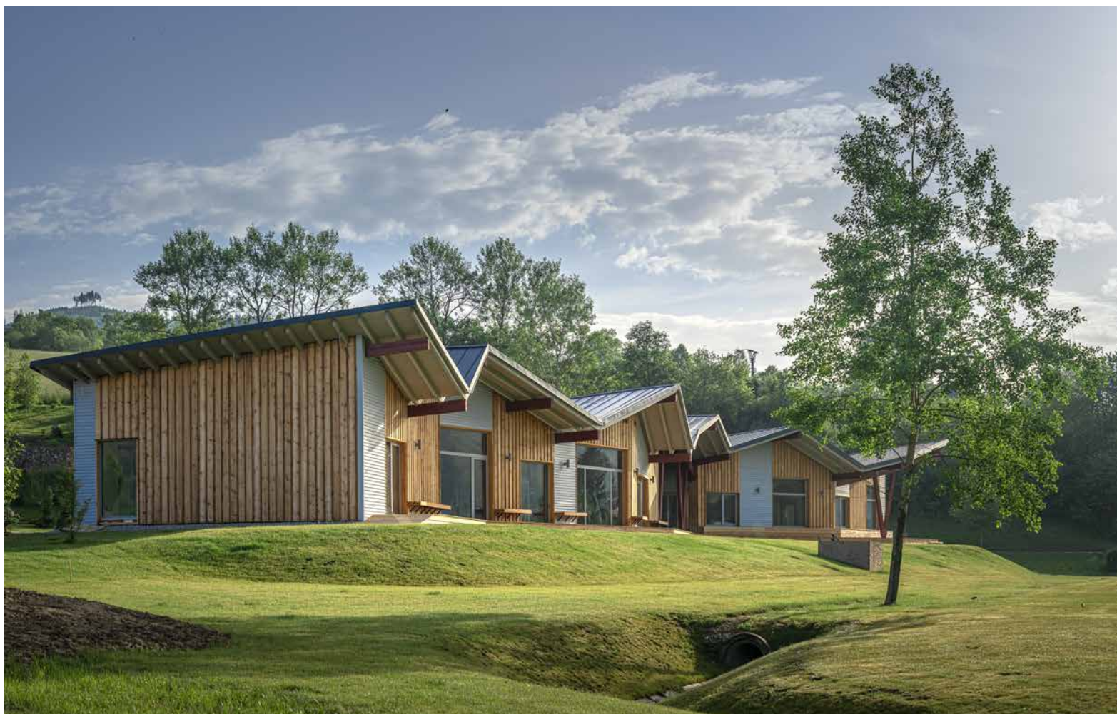
↑ Pohľad na fitness z prístupovej cesty.

Autori teda využili všetky svoje skúsenosti s drevostavbou a zasadili ju do prírodného rámca. Charakteristické sú lomené strechy, ide o tvar typický pre Ateliér VAN JARINA. Predtým však strecha slúžila ako prístrešok, teraz sa po prvýkrát premietla do uzavretej stavby a bol tak realizovaný aj tvarový experiment. Fitness centrum je ďalším sklíčkom do mozaiky spomenutých stavieb, ktoré zo Starej Bystrice vytvorili turistické centrum Slovenska.