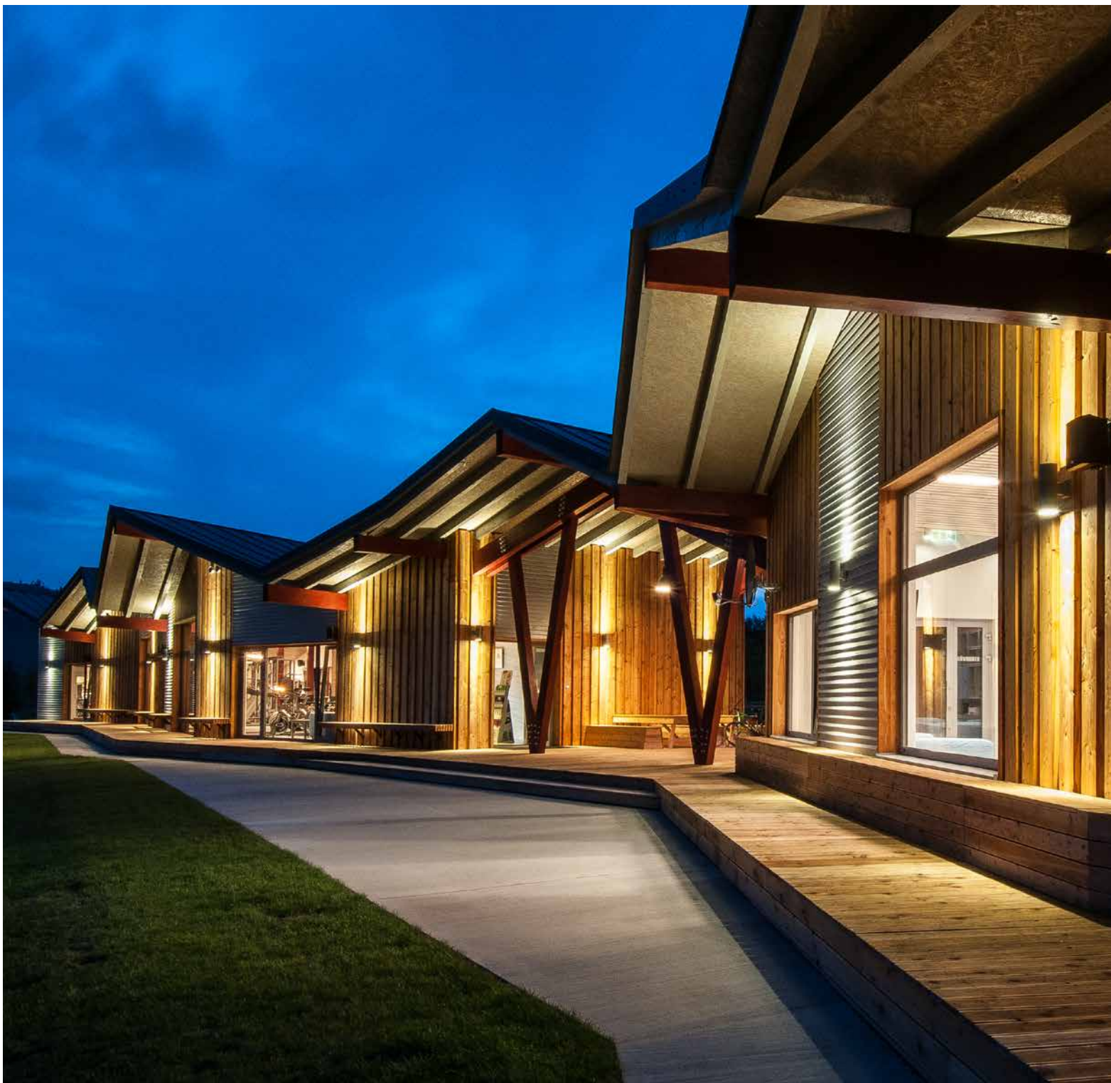
↑ Fasáda zo strany futbalového ihriska – tribúna.