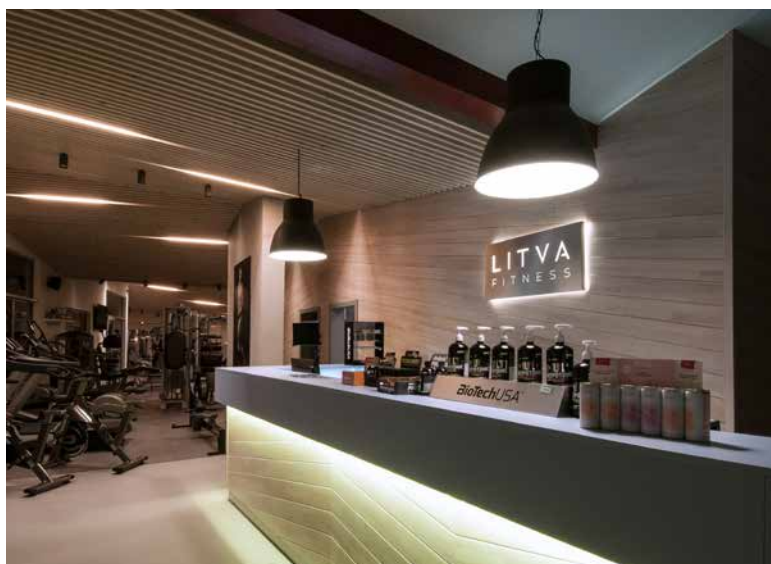
↑ Vstupný priestor do časti fitness.