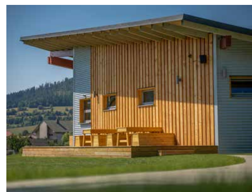
↑ Relaxačná zóna.