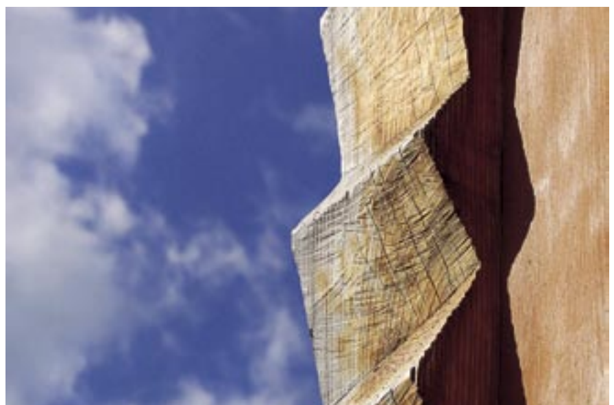
Krása dreva v detaile, Dom pod jabľoňou