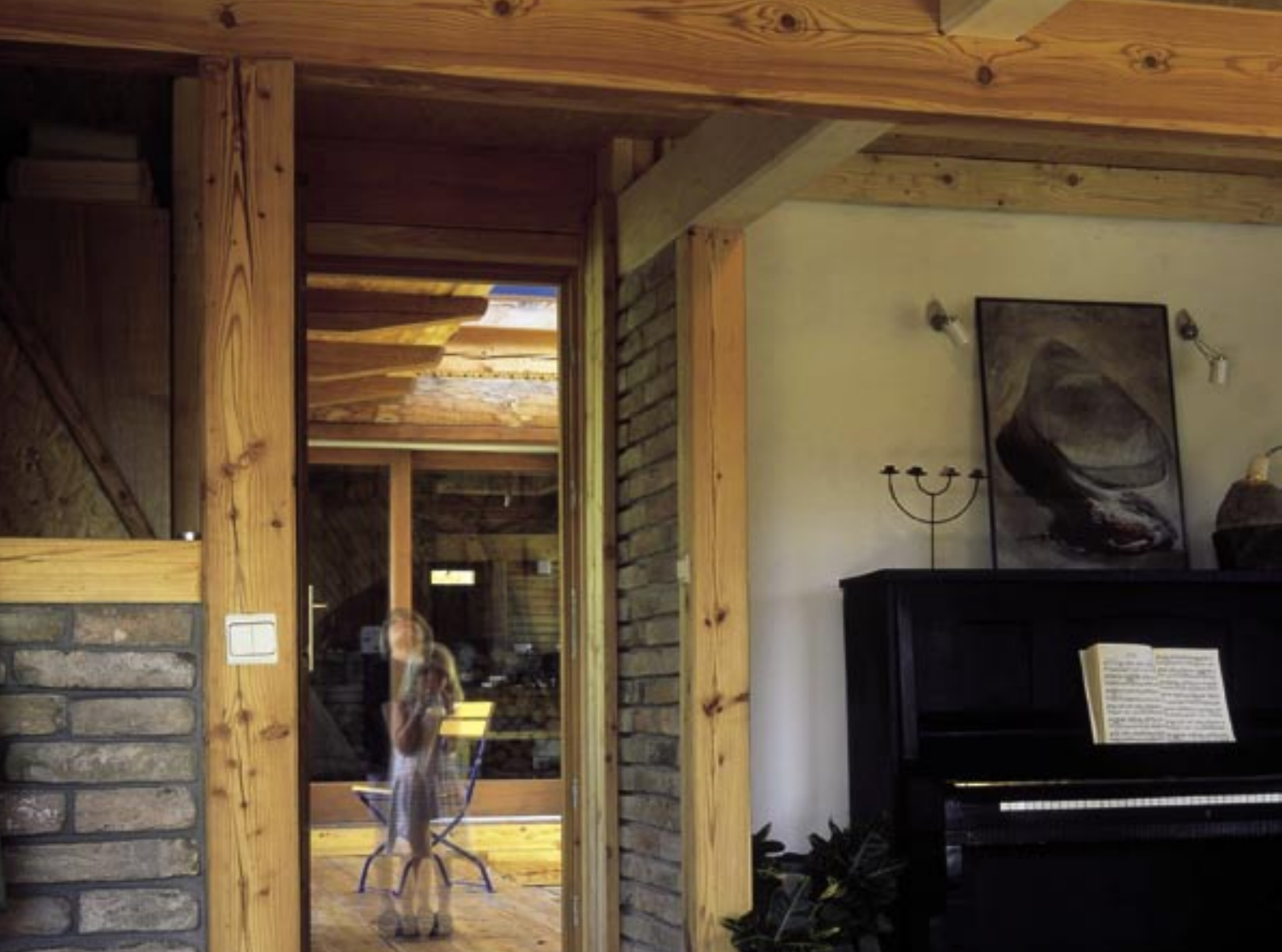
Dom pod jabloňou