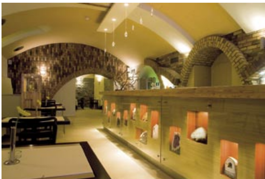
Hotel Dubná skala v Žiline