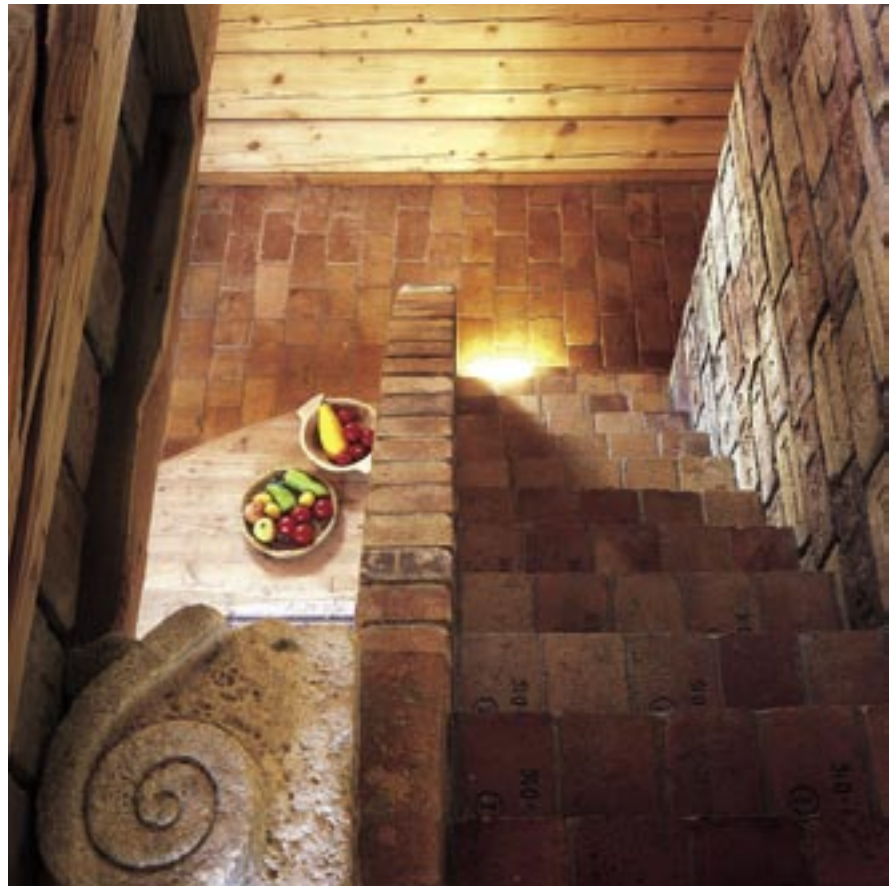
Priestor obložený použitými tehliami dýcha príbehmi z ich predchádzajúceho miesta, Dom pod jabloňou.

Mám pocit, že to súvisí s dnešnou posadnutosťou po formálnej dokonalosti a potrebou exhibicionisticky ju vystavovať na obdiv. Je zarážajúce, že svet starých, chorých či „nemoderných“ ľudí do tejto elitárskej architektúry akosi nepasuje. Možno treba povedať i to, že každá, aj minimalisticky navrhnutá domácnosť musí obsahovať aspoň pomyselnú obstarožnú skriňu s haraburdami ešte po starých rodičoch. Je v ľudskej povahe, že máme veci, ktoré jednoducho nechceme ukazovať, aj napriek móde. A tak by sme sa možno čudovali, čo všetko by sme našli skryté v zabudovaných skriňach minimalistického domu či ako