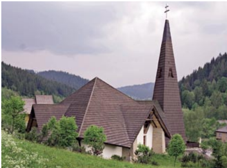
Kostol v Radôstke