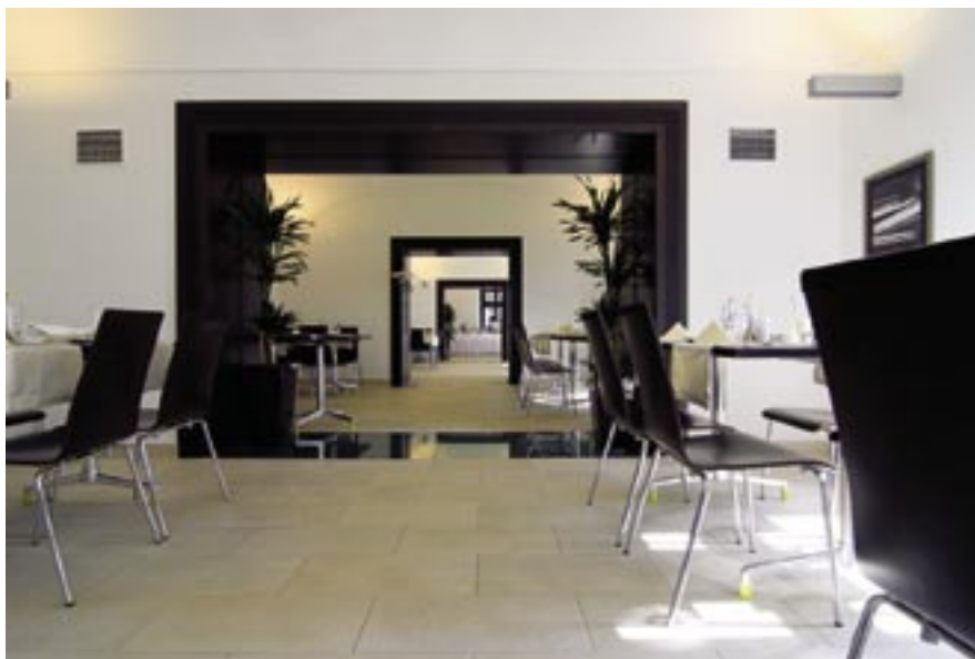
Interiér reštaurácie vo Ville Nečas v Žiline

Bude to znieť paradoxne, ale drevo je minimalistické: nie výrazom či formou, ale obsahom – je to azda ten najskromnejší materiál, ktorý môžeme v našich prírodných podmienkach použiť. Hneď po štúdiu som mal možnosť bližšie sa soznámiť s tvorbou Dušana Jurkoviča, ktorá