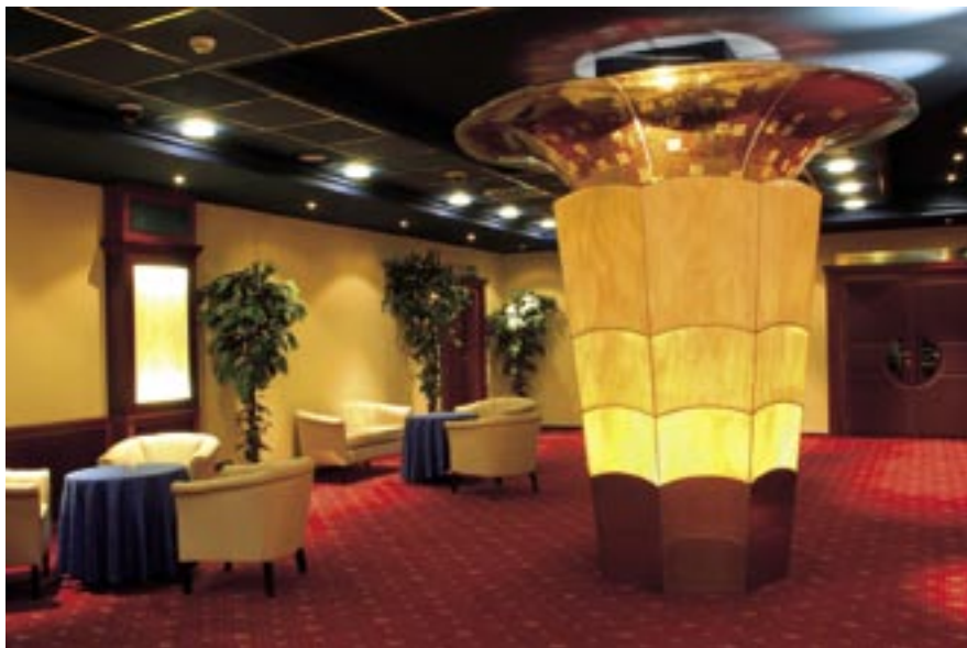
Regency Casino & Night Club, hotel Crown Plaza