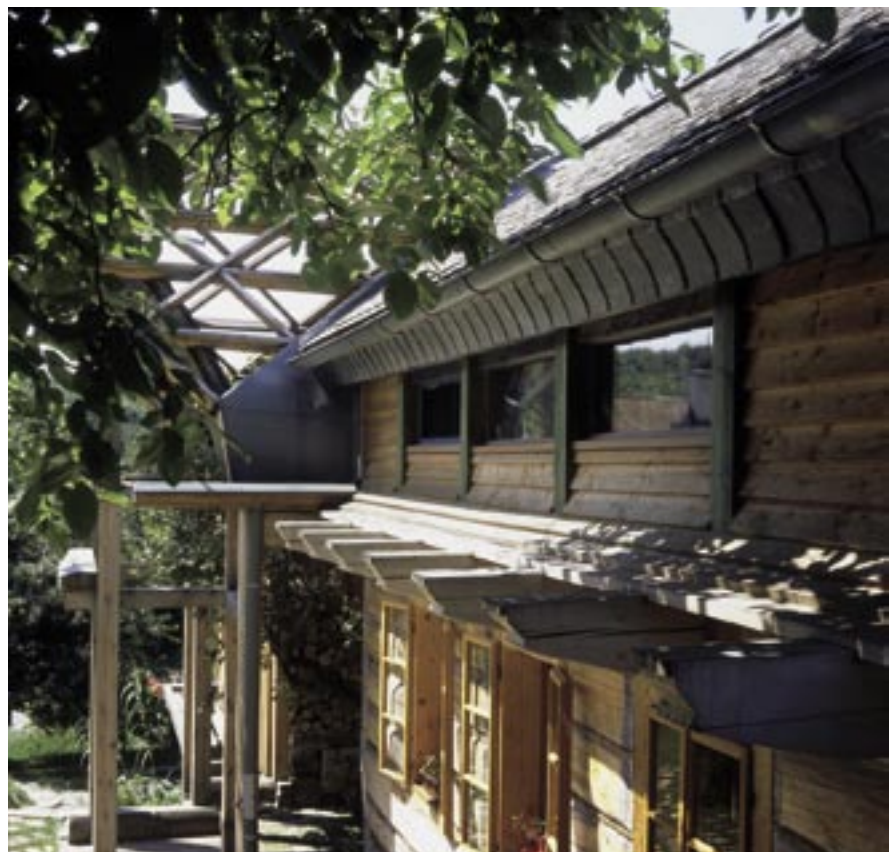
Dom pod jabloňou z exteriéru