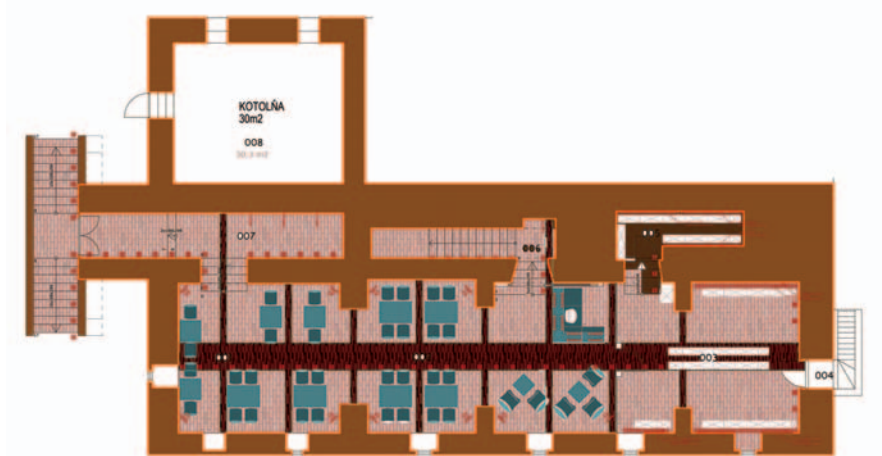
Pôdorys suterénu – vinotéka