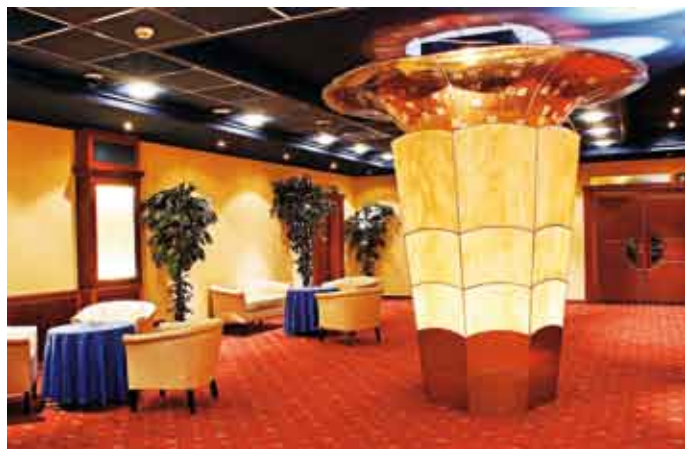
Vstup do Regency Casino &amp; Carat Club Crown Plaza